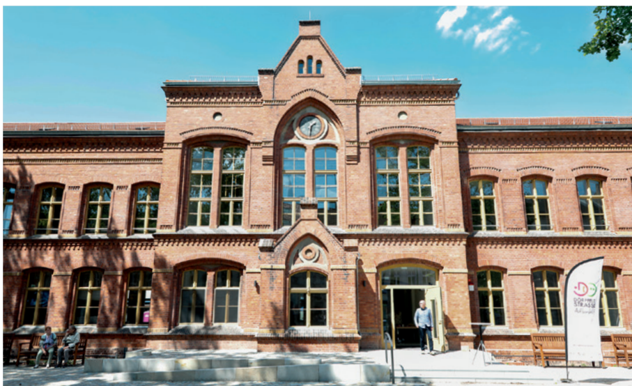
Kiezklub, Galerie, Kulturverwaltung sind schon eingezogen

Als zum Tag der Städtebauförderung am 23. Mai die Alte Schule erstmals nach Beginn der Umbauarbeiten für die Öffentlichkeit zugänglich war, kamen viele Adlershoferinnen und Adlershofer. Sie wollten sich selbst ein Bild davon machen, was das aus dem 19. Jahrhundert stammende ehemalige Schulgebäude Neues zu bieten hat. Die vorherrschende Grundstimmung könnte man mit „vorfremdliches Erwarten“ wohl ganz gut bezeichnen. Inzwischen ist die Baustelle übergeben. Seit August wurden die Räume im ersten Bauabschnitt, dem eigentlichen Schulgebäude, ihrer Bestimmung – u. a. Kiezklub, Galerie, Kulturverwaltung – übergeben.