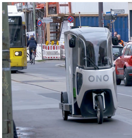
Ein Lastenrad verteilt im Rahmen eines Feldversuchs Sendungen in der Dörfeldstraße

Im Rahmen des Programms „Zukunftsfähige Innenstädte und Zentren“ wird derzeit die mögliche Umsetzung eines StadtteilHUBs untersucht. Hierzu konnten Fördermittel in Höhe von 225.000 € eingeworben werden. Im Rahmen des Pilot-